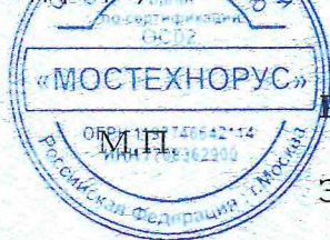
Схема сертификации 1с (ГОСТ Р 53603-2020 Оценка соответствия. Схемы сертификации продукции в Российской Федерации)