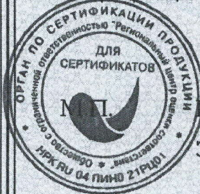
Схема сертификации 2с.